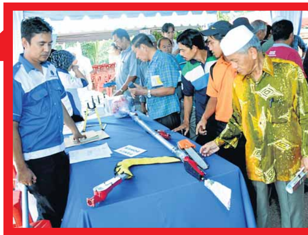
Pengunjung melihat peralatan yang dipamerkan pada Program Jom Guna CANTAS di Muar, baru-baru ini.

CANTAS bagi kerja penuaian buah sawit, penuai berupaya meningkatkan produktiviti hasil tuaian hampir dua kali ganda iaitu daripada 1.5 tan kepada 2.8 tan sehari.