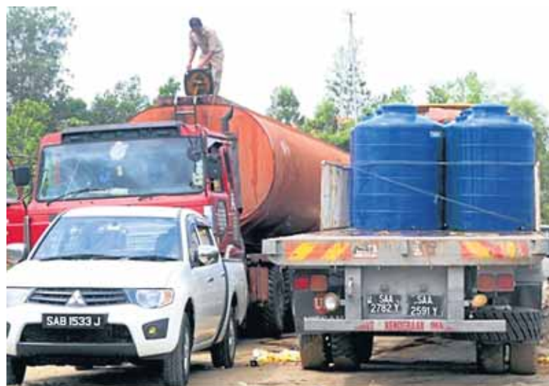
Lori tangki minyak sawit dan treler muatan tong minyak sawit curi ditahan oleh polis.

"Anggaran nilai pasaran MSM itu adalah RM29,592 berdasarkan