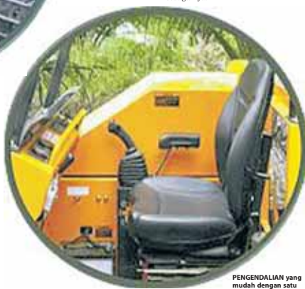
PENGENDALIAN yang mudah dengan satu pedal (single joystick).