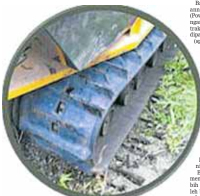
JAMINAN trek getah sehingga 2000 jam kerja.