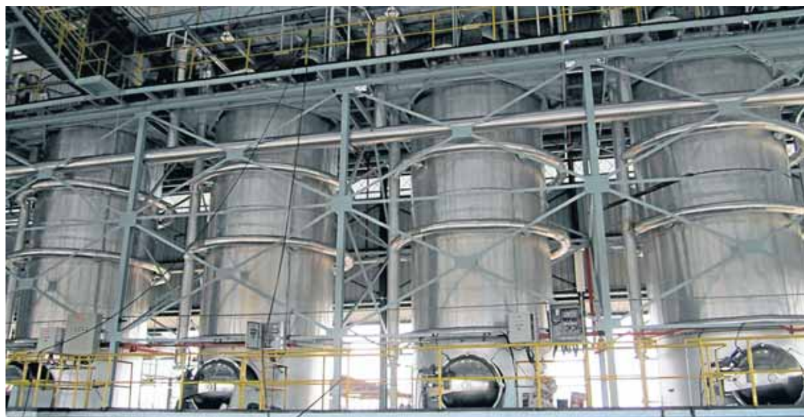
MODEL 'CHD Vertical Sterilizer' hasil ciptaan syarikat CHD IP Technology Sdn Bhd berupaya jimatkan tenaga dan penggunaan buruh kilang minyak sawit.

Hsu Hui berkata, sistem ini bersifat modular dan ia mampu memenuhi keperluan kadar pemprosesan sesebuah kilang sawit dan dari segi harga ia memberikan pen-