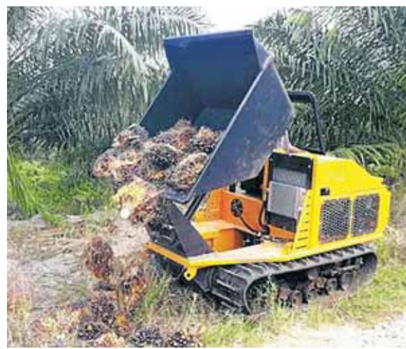
KENDERAAN pengangkutan buah sawit direka khas untuk kegunaan kawasan tanah gambut.