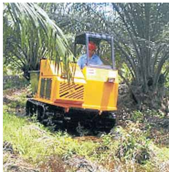
BELUGA mudah dikendalikan dan tidak tenggelam di kawasan tanah gambut.