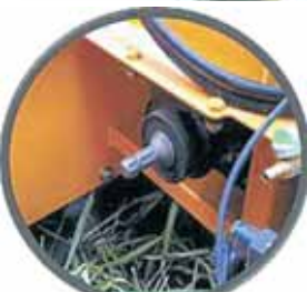
DIPASANG dengan PTO untuk kepelbagaian penggunaan untuk pemasangan alatan membaja dan racuran.