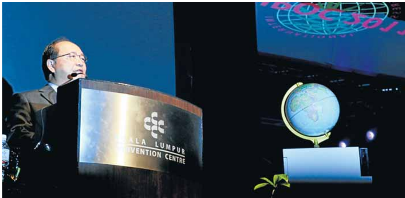
TAN Sri Bernard Dompok semasa merasmikan Kongres Antarabangsa Minyak Sawit MPOB (PIPOC 2011) di Pusat Konvensyen Kuala Lumpur (KLCC) baru-baru ini.

Menteri Perusahaan Perladangan dan Komoditi