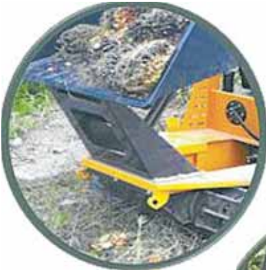
DIREKA bentuk dengan high pivot tipping bagi mengurangkan kerja berulang (double handling).