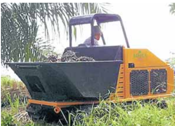
BELUGA amat efektif digunakan untuk mengangkut buah sawit di kawasan tanah gambut.

Bagi mereka yang berminat untuk mendapatkan maklumat dengan lebih lanjut berhubung jentera ini boleh berhubung dengan Ketua Pengarah MPOB untuk perhatian Mohd Solah Deraman selaku ketua projek pembangunan jentera untuk tanah gambut.